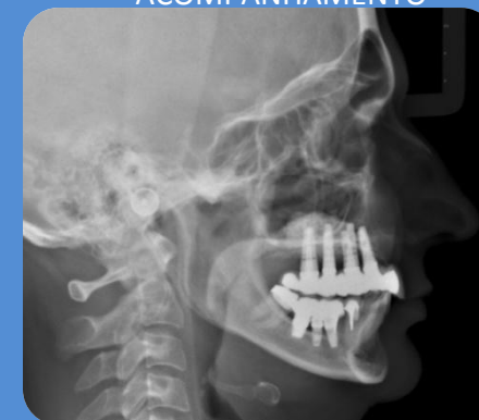
RADIOGRAFIA DE CONTROLE APÓS 2 ANOS DE ACOMPANHAMENTO