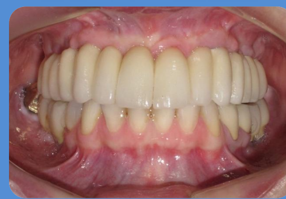
ASPECTO FINAL APÓS 02 ANOS DE CONTROLE