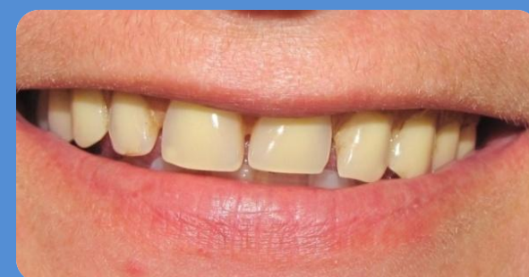
ASPECTO INICIAL DO SORRISO (SUPPORTED LABIAL INSATISFATÓRIO)