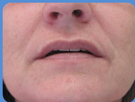
SUPORTE LABIAL RESTAURADO