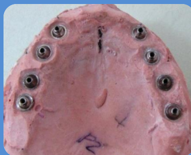
MODELO DE TRABALHO – DISPOSIÇÃO DOS IMPLANTES