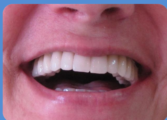
ASPECTO FINAL DO SORRISO