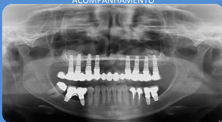
RADIOGRAFIA DE CONTROLE APÓS 2 ANOS DE ACOMPANHAMENTO